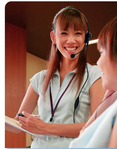
フィットネスクラブでのスタッフ間の連絡にプールなど水や汗に触れる環境でも気にせず携帯できます。