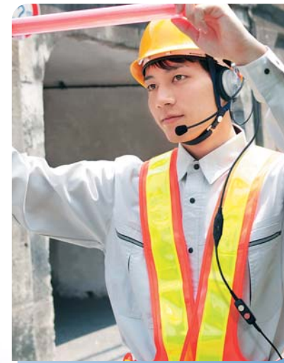
交通整理の連絡に車の騒音や雨の中でも、快適なコミュニケーションを実現します。