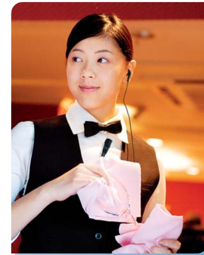
結婚式の円滑な進行にコンパクトなボディなのでスタッフの機動力を損やしません。