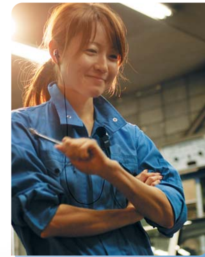
整備士と営業スタッフ間の連絡に軽量・堅牢なので、身につけていることを気にせず作業や商談を進めることができます。