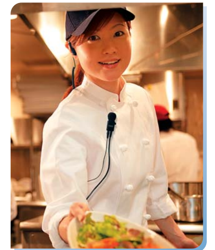
厨房とホールスタッフの連携に水や蒸気にさらされる厨房でも安心して使用できます。